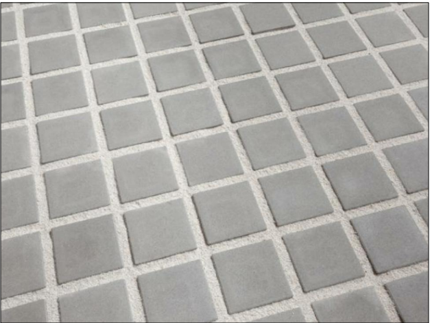
ROZMĚR DLAŽBY 200x200mm